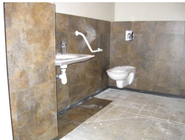
Les toilettes du Parc, avec contrastes de couleurs.