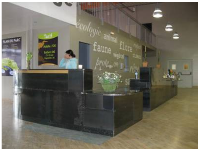
Les comptoirs, d'accueil et du Bar, au Parc animalier à Argelès-Gazost.