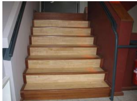
Millaris à Gèdre.