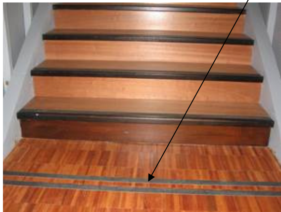
Médiathèque de Lourdes ;

Toute indication écrite à l'intention de la clientèle doit être écrite en gros caractères.