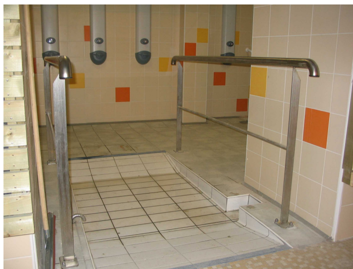
Piscine Municipale de Bagnères de Bigorre, 65200.