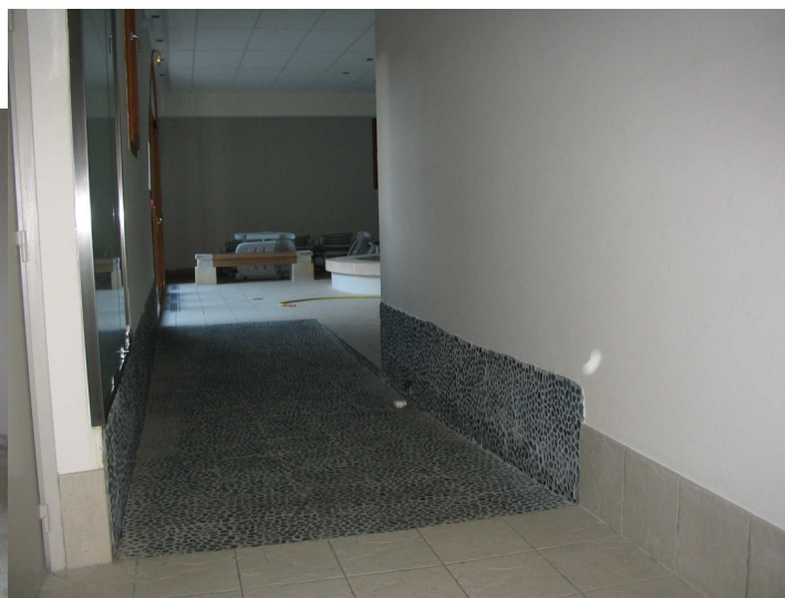
Résidence Cami Réal à Saint-Lary Soulan, 65170.