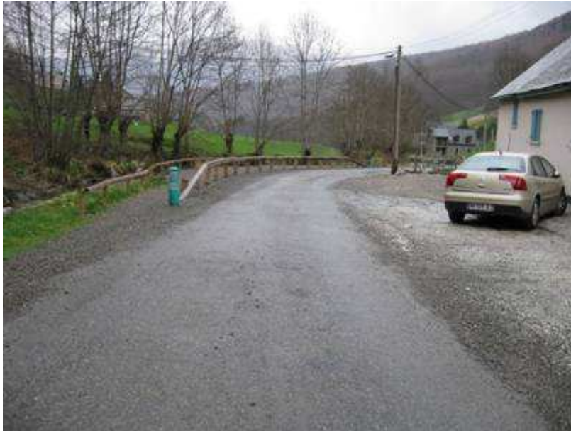
Parking mis à disposition par une structure privée, et vue vers l'aval