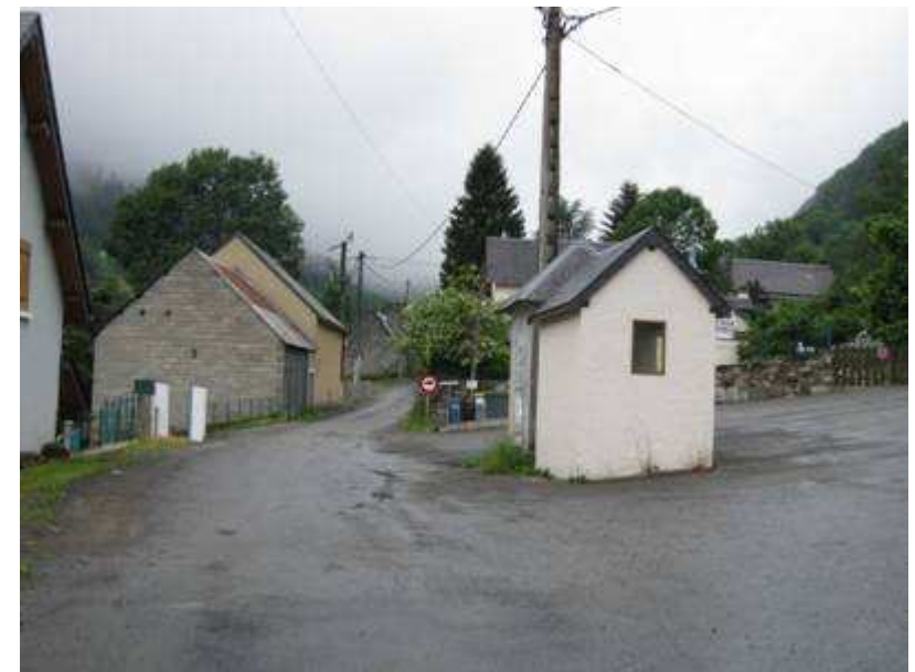
C'est là qu'on quitte la route de La Mongie, à Gripp, pour atteindre le parcours.