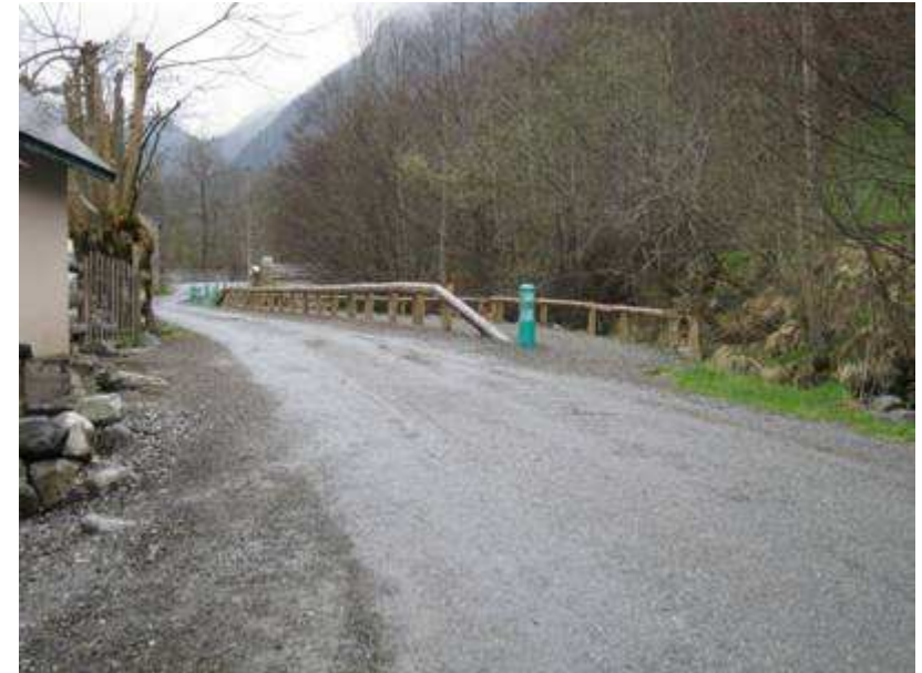
Vue vers l'amont depuis le même parking.