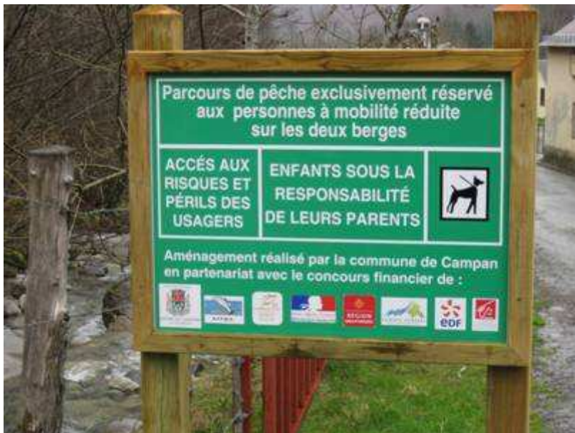
Panneau indiquant l'exclusivité, après d'âpres discussions !